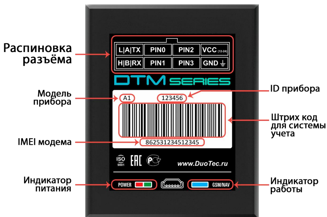
Рисунок 2. Внешний вид устройства и наклейки