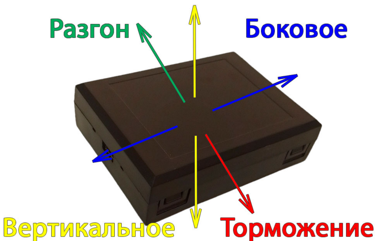
Рис1. Направления ускорений

Для качественного контроля стиля вождения необходимо расположить прибор в транспортном средстве в соответствии с осями движения (см. рис. 1) и жестко зафиксировать на ТС.