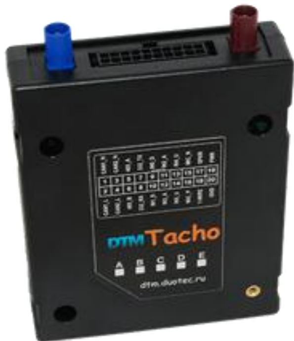
Рис 1. вид сверху на устройство.