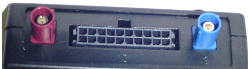
Рис 2. Передняя панель прибора.