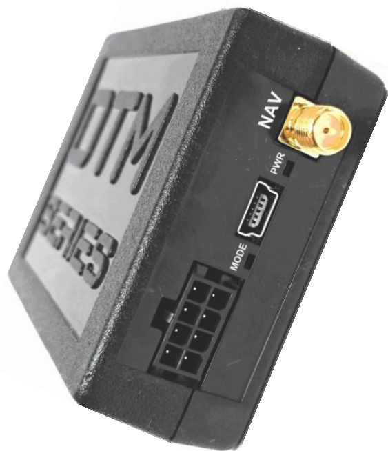
Рис 1. вид сверху на устройство.