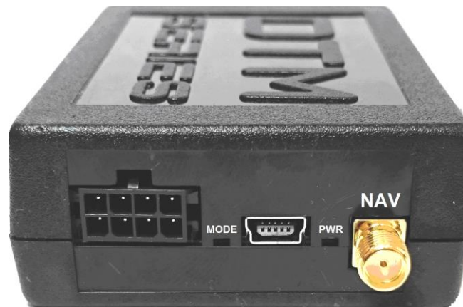
Рис 3. Передняя панель прибора.

NAV - разъем для подключения внешней антенны GPS/GLONASS.